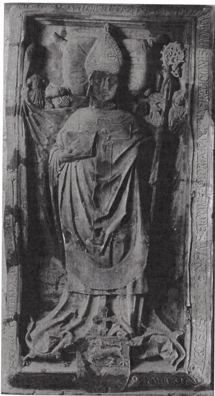
Vitéz János sírköve 1472-ből az esztergomi székesegyház altemplomában

Vitézeket, akik csak az első tapogatózó lépéseken lehettek túl, amikor pártütésük hírére Mátyás otthagya Csehországot, és 1471 nyarán Budára sietett.